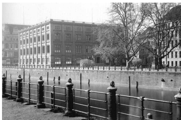
Bauakademie, Foto 1930, Förderverein Bauakademie / Messbildanstalt

(Erstveröffentlichung 2012, letzte Überarbeitung am 30.3.2021)